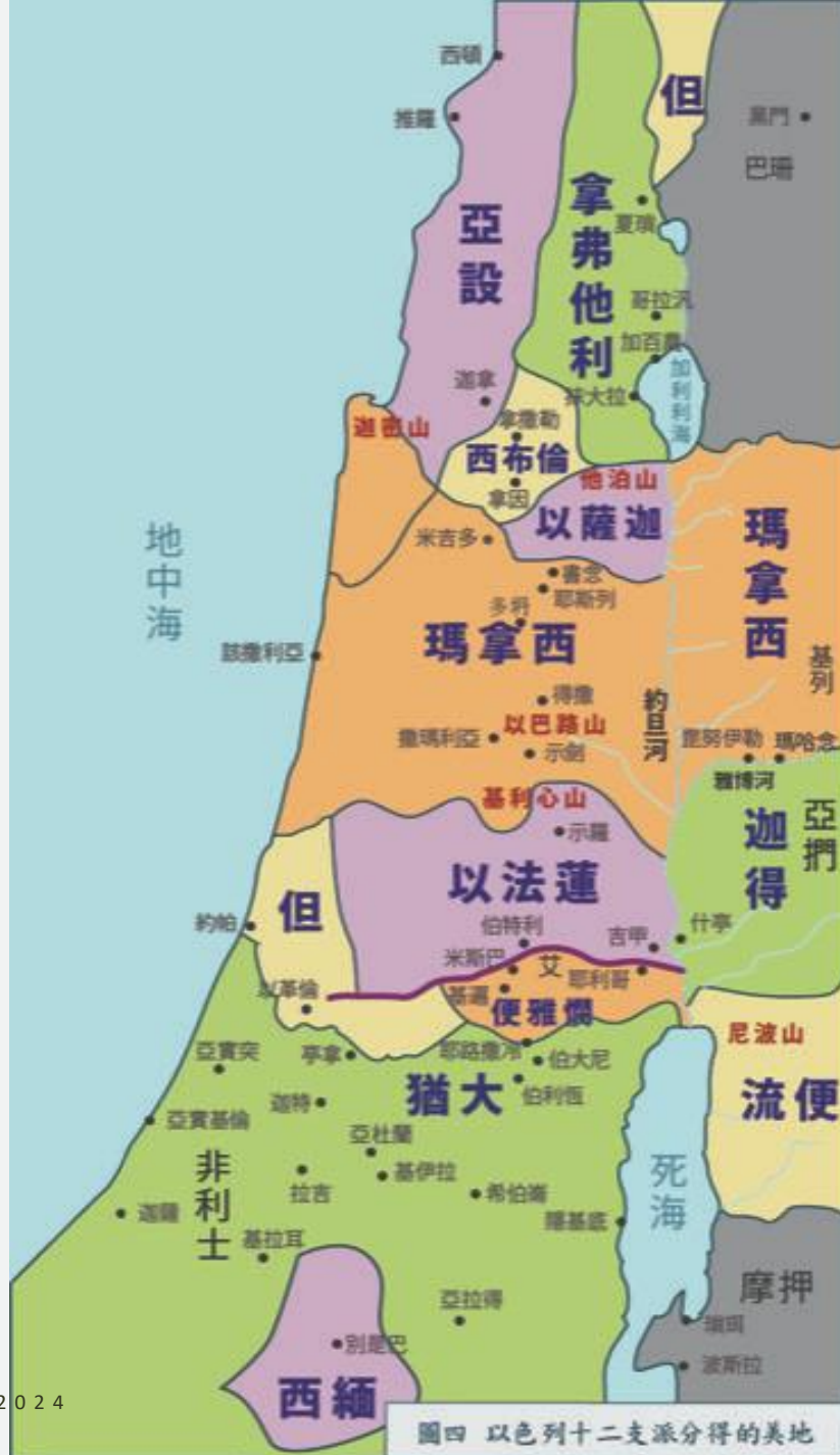
圖四 以色列十二支派分得的美地